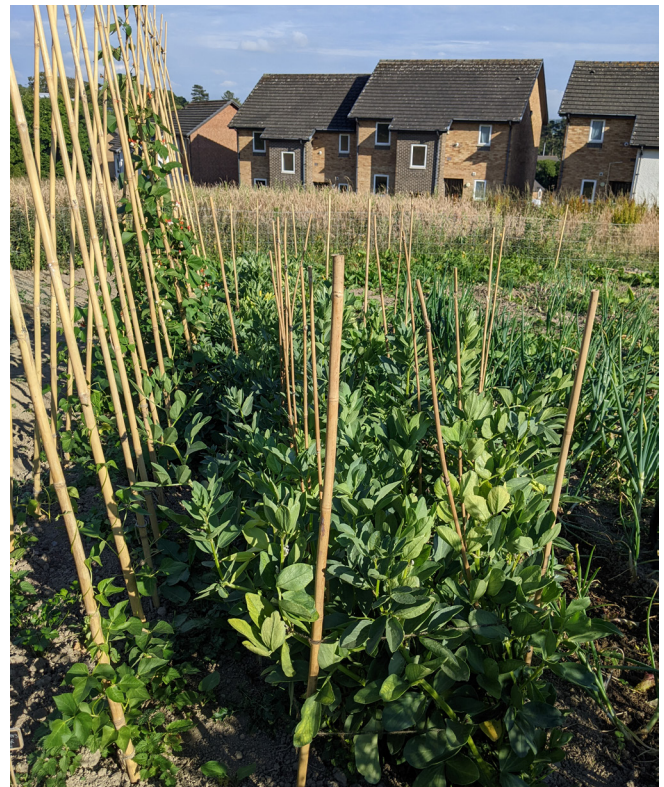
Ffa Padarn Sant

Rhandir Ail Ryfel Byd Aber yw elfen gyntaf prosiect 'Yr Ardd Hanes Byw' y bwriedir ei gynnal ar y safle, a bydd yn cynnwys gardd berlysiâu ganoloesol, plotiau garddio ar gyfer y myfyrwyr a'r gymuned, a pherllan o goed ffrwythau traddodiadol i nodi pen blwydd y Brifysgol yn 150. Rydym yn gobeithio datblygu'r prosiect fel y gellir ei ddefnyddio wrth ddysgu ac mewn gweithgareddau estyn allan gydag ysgolion. Y tu hwnt i unrhyw wersi hanesyddol, fodd bynnag, mae rhandir Ail Ryfel Byd Aber yn dangos gwerth garddio, ar gyfer gweithgareddau awyr agored, er mwyn bwyta'n iach ac yn gynaliadwy, ac er mwyn lles.