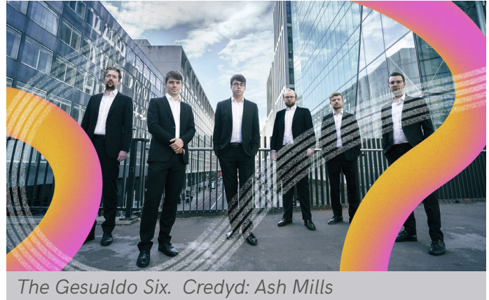
The Gesualdo Six.