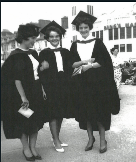
Menywod mewn cap a gŵn gyferbyn â Neuadd y Brenin

Mae amserlen diwrnod graddio hefyd wedi gweld newid, ac mae'n naturiol gofyn felly sut brofiad ydoedd yn y gorffennol?