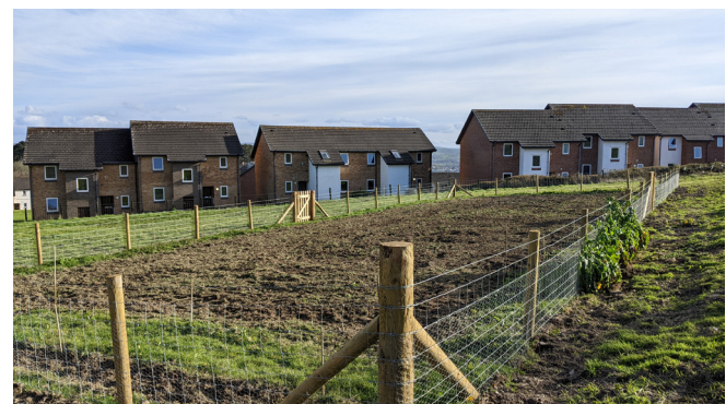
Y ffens newydd i atal cwningod, Ebrill 2023