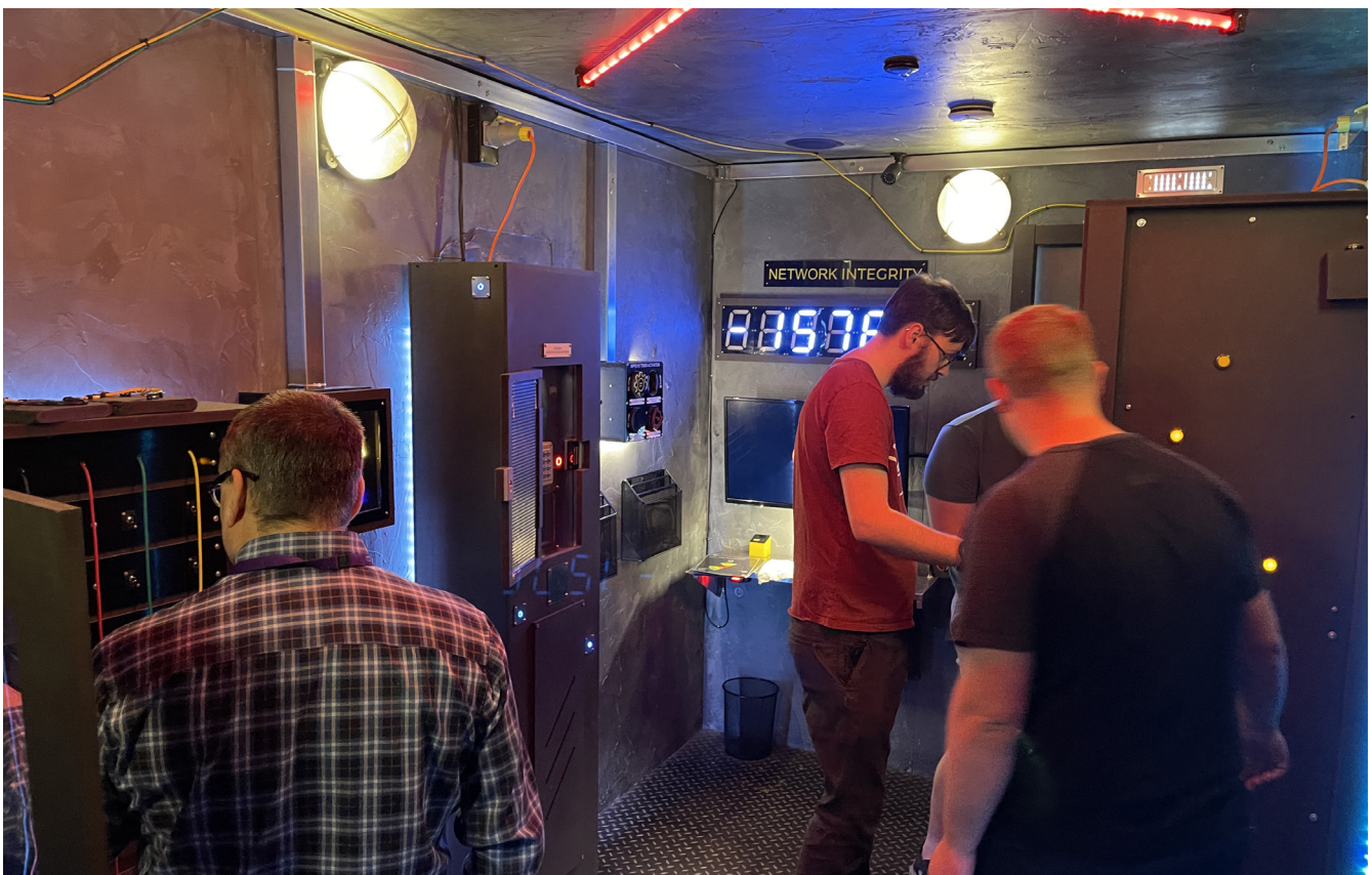
Tîm o'r Gwasanaethau Gwybodaeth