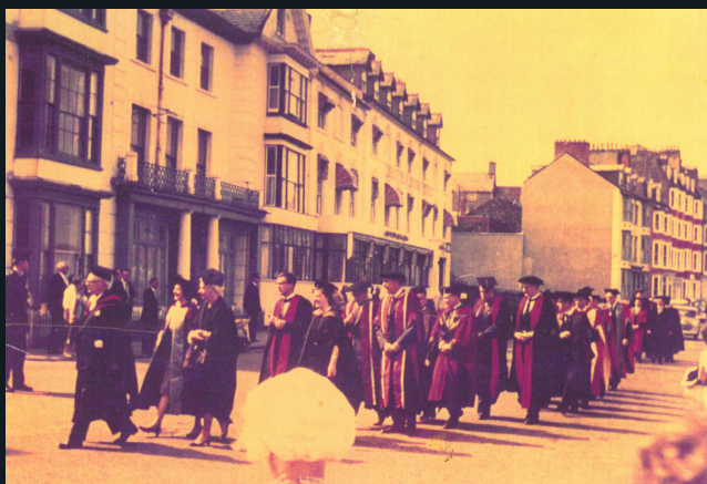
Yr orymdaith graddio yn y 1960au, dan arweiniad y Prifathro Syr Thomas Parry

Yn 1967, roedd y canllawiau ar gyfer gwisg braidd yn gyfyng. Nodwyd y dylai myfyrwyr gwrywaidd wisgo siwtiau tywyll, coleri gwyn a thei'r Coleg ac y dylai myfyrwyr benywaidd wisgo sgertiau tywyll, hosanau, blowsiau gwyn a thei'r Coleg. Yn wir, mae'r oes wedi newid!