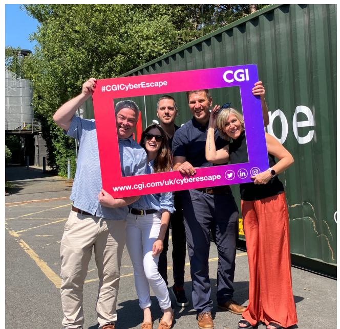
Tîm o Wasanaethau Myfyrwyr

Trefnwyd Cyber Escape gan y Gwasanaethau Gwybodaeth, ac roedd yn gydweithrediad rhwng CGI (ymgyngorwyr TG a busnes) Heddlu Dyfed-Powys, a'r Ganolfan Seibergadernid yng Nghymru.