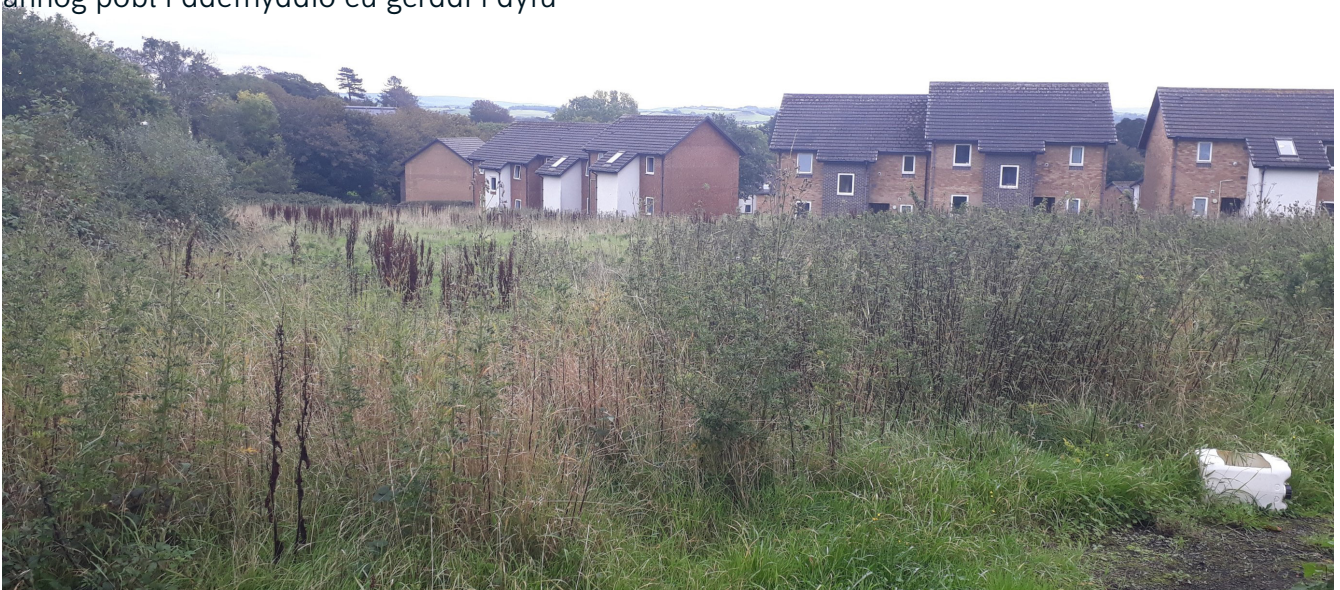
Chwyn oedd wedi hen ymsefydlu, cyn trin y tir

llysiau (ymgyrch 'Dig for Victory'). Y bwriad yw rhoi cyfle i fyfyrwyr, staff a gwirfoddolwyr o'r gymuned gael profiad o ddulliau garddio'r gorffennol, tyfu eu llysiau eu hunain, cyfrannu at gynaliadwyedd bwyd y gymuned a mwynhau rhan newydd, werdd o'r campws.