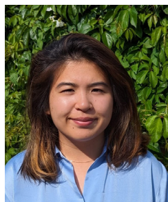
Jia Ping Lee Cydlynnydd Datblygu Sgiliau a Galluoedd Digidol