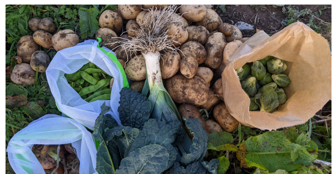
Cynnyrch ar gyfer Gwarged Bwyd Aber