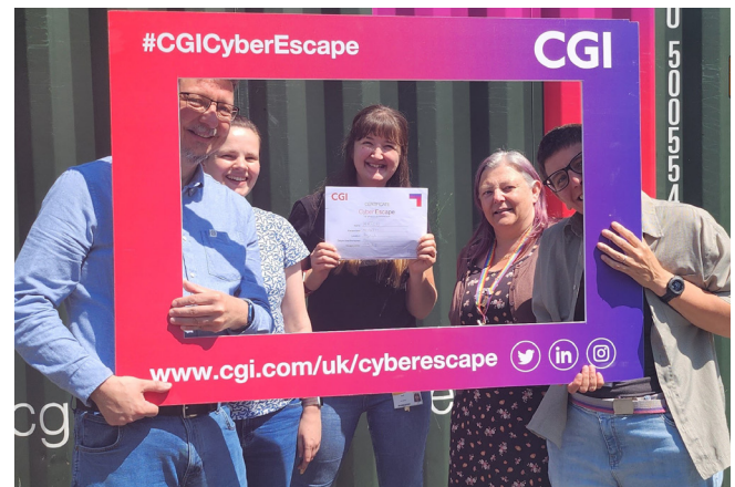
Tîm o'r Adran Gyfrifiadureg