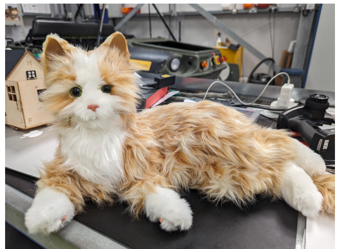
Y gath robot. 'Pixel'