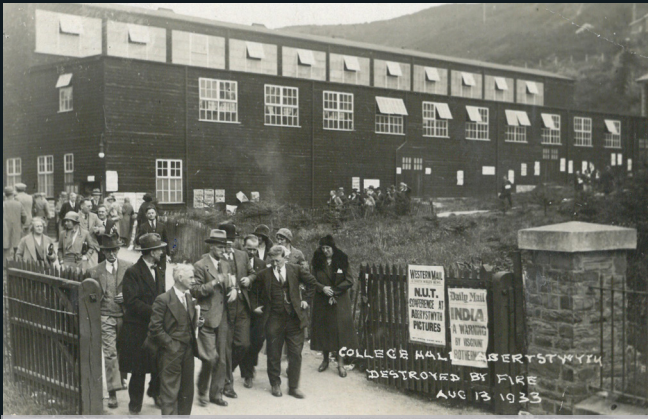
Neuadd y Coleg, Aberystwyth