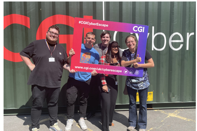
Tîm o Adnoddau Dynol

Mae'r Gwasanaethau Gwybodaeth yn gobeithio gallu dod â'r profiad Cyber Escape yn ôl i'r campws eto yn 2024.