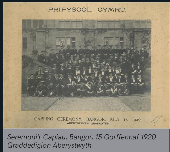
Seremoni'r Capiâu, Bangor, 15 Gorffennaf 1920 - Graddedigion Aberystwyth

Un gwahaniaeth amlwg, ar ôl 1902, yw y byddai pob un o golegau cyfansoddol Prifysgol Cymru yn cymryd ei dro i groesawu ei chwaer-golegau fel y gwelir isod yn y llun o raddedigion Aber ar daith yn 1920.