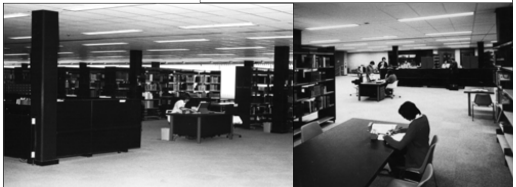
Llyfrgell Hugh Owen ym 1976, ac roedd y gwasanaethau archebu a benthyca llyfrau ar Lawr E.