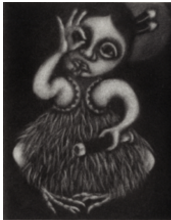
Julia Ellery (Seland Newydd), 'Hei Tiki Lookout', mezzotint