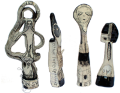
Terence Wilde, 'Embodiments'