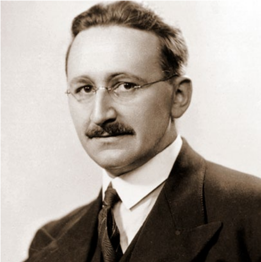
Friedrich von Hayek (1899-1992)

Y Dde Newydd neogeidwadol: Mae'r dadleuon a gysylltir â'r gangen hon yn tueddu i ategu'r pwyslais neoryddfrydol ar sicrhau bod angen cyfyngu'n sylweddol ar ymyrraeth economaidd y wladwriaeth. Ar yr un pryd mae'r adain neogeidwadol hefyd yn canolbwyntio ar faterion cymdeithasol ychwanegol ac wrth wneud hynny yn adeiladu ar syniadau Ceidwadol ynglŷn â phwysigrwydd trefn, awdurdod a disgyblaeth – syniadau y gellir eu holrhain yn ôl i rai o'r Ceidwadwyr Awdurdodaidd a fu'n weithredol yn ystod y bedwaredd ganrif ar bymtheg. Rhoddwyd sylw o'r newydd i'r math yma o syniadau yn sgil y dybiaeth bod rhai o'r diwygiadau cymdeithasol rhyddfrydol a gyflwynwyd ar draws gwledydd gorllewinol yn ystod y 1960au, er enghraifft cyfreithloni ysgaru ac erthylu, diddymu'r gosb eithaf, llacio rheolau ar sensoriaeth a hefyd cydnabod amrywiaeth trwy bolisiâu ar amlddiwylliannedd, wedi tanseilio ymdeimlad o sefydlogrwydd a dyletswydd gymdeithasol. Yn sgil hynny, mynnwyd y bu dirywiad difrifol mewn cyfraith a threfn a hefyd mewn moesoldeb cyhoeddus.