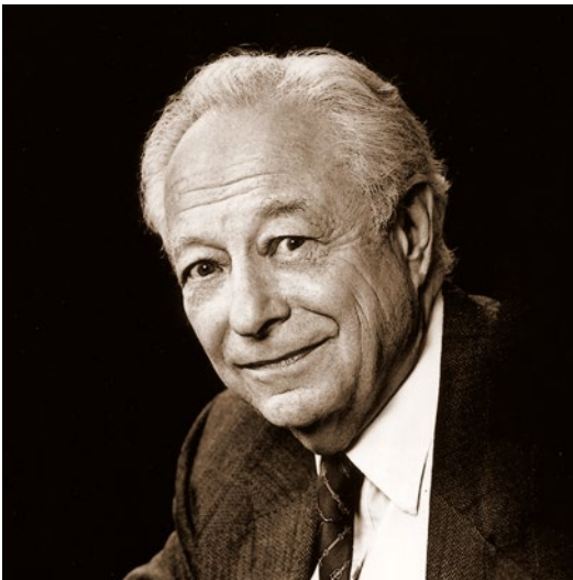
Irving Crystol (1920-2009)

At ei gilydd, mae'r Dde Newydd yn gorff digon brith o syniadau gwleidyddol sy'n ceisio cyfuno math penodol o ryddfrydiaeth economaidd ag ymagwedd geidwadol awdurdodaidd wrth drafod materion cymdeithasol. Yn hynny o beth, mae'n gorff o syniadau sy'n cyfuno elfennau radical, adweithiol a thraddodiadol oll gyda'i gilydd. Heb amheuaeth, profodd y syniadau hyn yn arbennig o ddylanwadol yn ystod degawdau olaf yr ugeinfed ganrif. Rhoddwyd y mynegiant mwyaf amlwg iddynt yn ystod y 1980au ar ffurf Thatcheriaeth yn y Deyrnas Unedig a Reaganiaeth yn yr Unol Daleithiau. Fodd bynnag nid dim ond ffenomen a brofodd yn ddylanwadol yn y lleoliadau hyn yn unig oedd y Dde Newydd. Bu iddo hefyd adael ei ôl ar wleidyddiaeth mewn rhannau eraill o Ewrop, Awstralia a Seland Newydd.