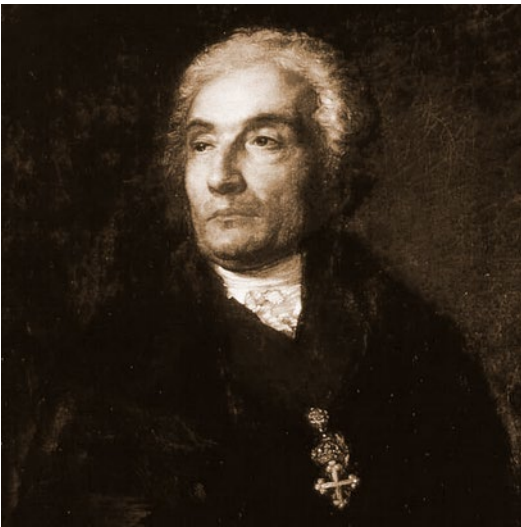
Joseph de Maistre (1753-1821)

Ar fwy nag un achlysur, mae Ceidwadwyr o anian awdurdodaidd hefyd wedi ceisio harneisio cefnogaeth werinol i hybu eu hachos. Llwyddwyd i wneud hyn hyd yn oed yn Ffrainc ei hun, pan lwyddodd Louis Napoleon i ennill cefnogaeth etholiadol trwy blethu awdurdodaeth ag addewid o ffyniant economaidd, cam a'i galluogodd, maes o law, i benodi ei hun yn Ymerawdwr. Tebyg hefyd, ond yn fwy diweddar, fu apêl y traddodiad Peronistaidd yn yr Ariannin rhwng 1946 a 1955. Mudiad poblyddol oedd hwn a lwyddodd i sicrhau cefnogaeth o blith y werin dlawd, ond ar sail rhaglen wleidyddol a bwysleisiai ufudd-dod, trefn, ac undod cenedlaethol. Gellir gweld elfennau o'r traddodiad hwn yn parhau mewn rhai rhannau o'r byd heddiw, megis yn y Dwyrain Canol a rhai o wledydd Affrica, ond heb y cysylltiadau mwy 'Ffasgaid' Ewropeaidd.