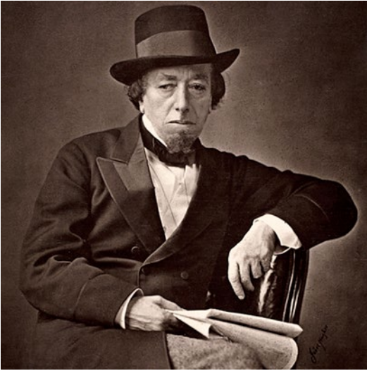
Benjamin Disraeli (1804-1881)

Cafodd dadleuon Disraeli ddylanwad ar nifer o geidwadwyr Prydeinig diweddarach. Er enghraifft, yn ystod degawdau olaf y bedwaredd ganrif ar bymtheg, wrth i drefniadau democrataidd ennill tir ar raddfa gyflym, rhybuddiodd Randolph Churchill fod angen gweithio i sicrhau cefnogaeth gymdeithasol eang i hen sefydliadau traddodiadol megis y Frenhiniaeth, Tŷ'r Arglwyddi a'r Eglwys Anglicanaidd. Mynnodd y gellid cyflawni hyn trwy ddenu aelodau'r dosbarth gweithiol at y Blaid Geidwadol wrth barhau â pholisi Disraeli o ddiwygio cymdeithasol gofalus.